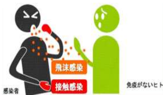
図1 新型インフルエンザの感染経路

(6) 国内で感染が始まった場合、お客様、従業員や家族に38度以上の発熱、咳、全身倦怠感等の症状がある場合、保健所又は発熱相談センターに連絡し、指示に従ってください。自宅で本人または家族に症状が出たと連絡を受けたら入社させてはいけません。家族も同様に外出を控えなくてはなりません。