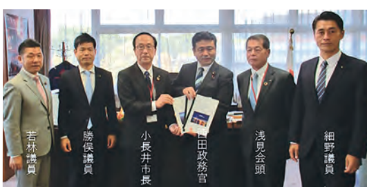
国土交通省 西田昭二大臣政務官への要望

▼田子の浦港振興ビジョンに基づく地域の安全性向上とプロムナードゾーンにぎわい創出事業への協力