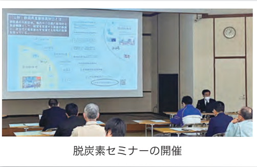
脱炭素セミナーの開催