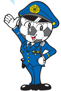
静岡県警察 シンボルマスコット 「エスピーくん」