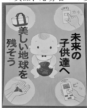
(小学生の部 最優秀賞)