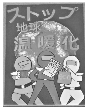
(小学生の部 理事長賞)