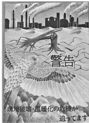
(中学生の部 最優秀賞)