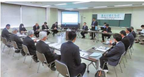
令和8年度キックオフミーティング

(株)石井組は、土木工事のみならず、民間工事や官公庁工事から様々な建築物の建設、リフォーム、耐震補強など多岐にわたる事業を説明し、生徒は「まちをつくる・ものをつくる」という仕事の本質に、工業との共通点を感じていました。 今年度初回の開催でありましたが、当日は60名を超える生徒が集まり、当事業が同校に徐々に浸透していることが明瞭になりました。参加した企業からは、「OBから仕事の話聞ける貴重な機会だと思う」、「自社に限らず様々な会社や仕事があることを知って欲しい」など、本事業に期待を寄せる感想が得られました。