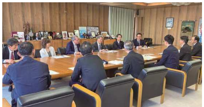
富士市の持続的な発展に向け、市長と活発な意見交換をする正副会頭

吉原工業高校は市内外だけでなく県外からも高く評価される人材を輩出しており、産業都市である富士市の将来のために、同校の存続に力を入れて取り組んでほしい」と伝えました。