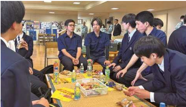
東名電機(株) (上)、(株)石井組 (下)

地元企業に就職した吉原工業高校の先輩と、仕事のやりがいや面白さ、入社決め手や製品紹介などをカフェ形式で気軽に対話する「キャリアカフェ」を本年度も計8回開催します。 第1回は4月28日(火)に、東名電機(株)と(株)石井組が参加しました。