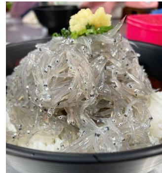
日本一の田子の浦しらす