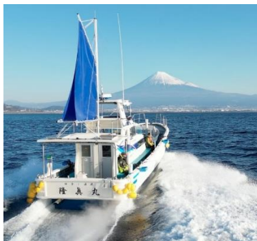
ダイナミックな富士山&駿河湾