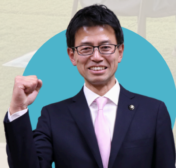
富士市長 金指祐樹氏