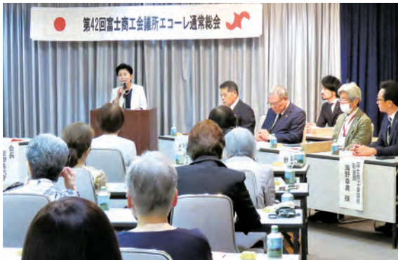
菅野前会長の挨拶