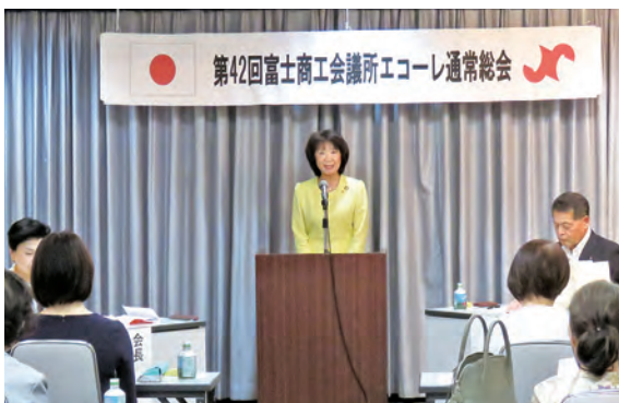
開会宣言をする高井新会長