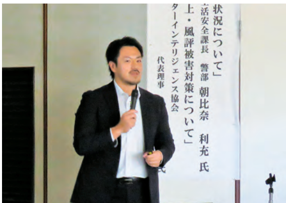
稲村氏が「企業における炎上・風評被害対策」について講話