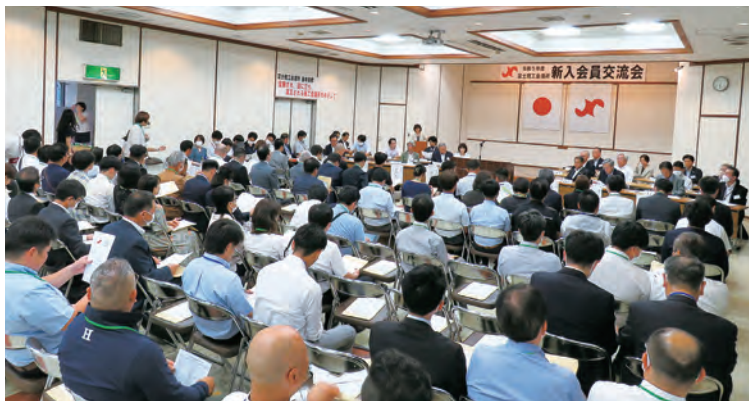
第1部 会議所事業説明会

交流会は66社93名の新入会事業所と会頭、副会頭、専門指導員、当所経営指導員など約140名が参加し、前半の会議所事業の説明と後半の懇親会の2部制で行われました。